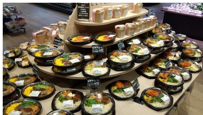
Harves LINKS UMEDA店のお弁当