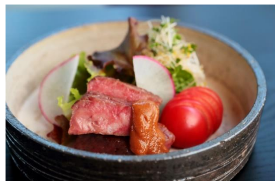
〈（オプション）大和牛ローストビーフ〉