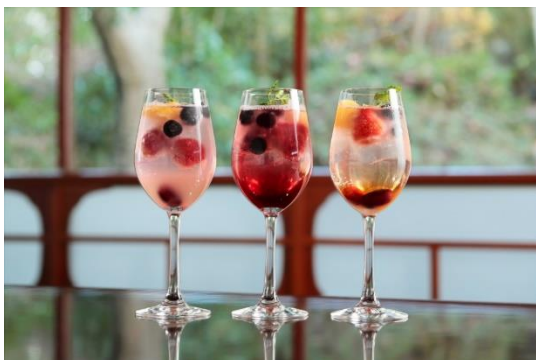
〈フルーツ&ピネガードリンク〉