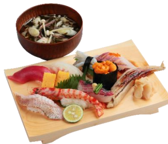
大ネタにぎり寿司セット 2,800円