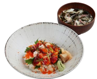
海鮮ちらしの海藻汁セット 1,500円