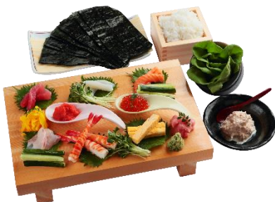
手巻き寿司セット (3名さま分) 3,600円

お連れさま、ご家族さまとでもお楽しみいただけるセットメニューをご用意しております。