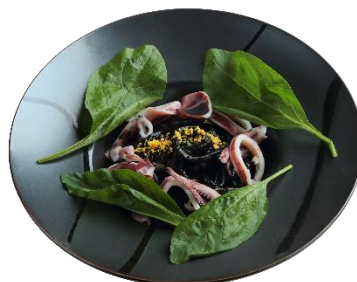
漆黒のイカスミうどん