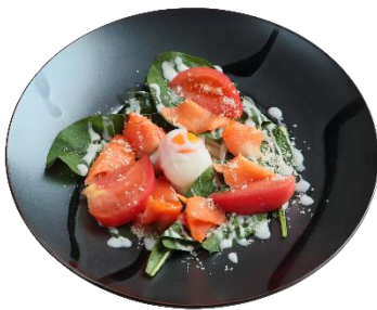
ほうれん草とスモークサーモンのうどん