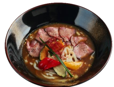
牛たんカレーうどん