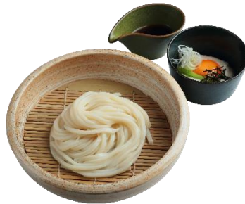
伊勢芋とろろのつけうどん