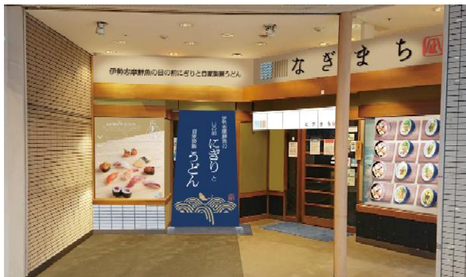
〈なぎまち 外観イメージ〉