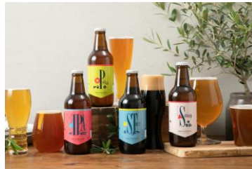
大和醸造オリジナルビール 「はじまりの音」 (各 700~900 円)