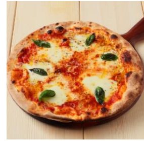
マルゲリータ (1,100 円)