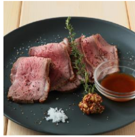
ローストビーフ (1,650 円)