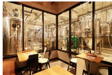
〈大和醸造・併設レストラン “YAMATO Craft Beer Table”〉