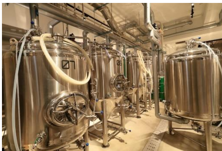
〈大和醸造 (ビール醸造用タンク)〉

「大和醸造」は2020年1月にビール製造免許を取得し、近鉄奈良駅前に開業したビール醸造所です。「クラフトビールで人と人との和を紡ぐ」をコンセプトとしてオリジナルクラフトビールを提供しています。大和醸造定番ビール「はじまりの音(ね)」シリーズのうち、「はじまりの音 スタウト」は、「インターナショナルビアカップ 2021」と「ジャパン・グレートビア・アワーズ 2021」で金賞、「はじまりの音 セゾン」は、「インターナショナルビアカップ 2022」で金賞を受賞しています。