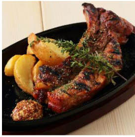
スペアリブ (1,650 円)