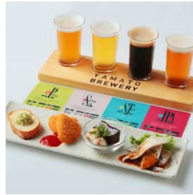
ペアリングセット (2,400 円)